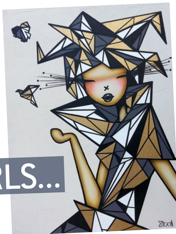
Stoul, Ouu Hearbreaker , 2015, Acrylique et aérosol sur toile, Signée et datée au dos, 81 x 60 cm

Du 7 au 24 juillet, la Bab's Galerie met la création féminine à l'honneur !